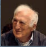
Jean Vanier fondatore della comunità dell'Arca