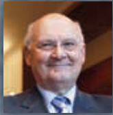
Stefano Zamagni economista