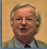
Xavier Le Pichon geofisico Collège de France