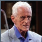
Eugenio Borgna psichiatra